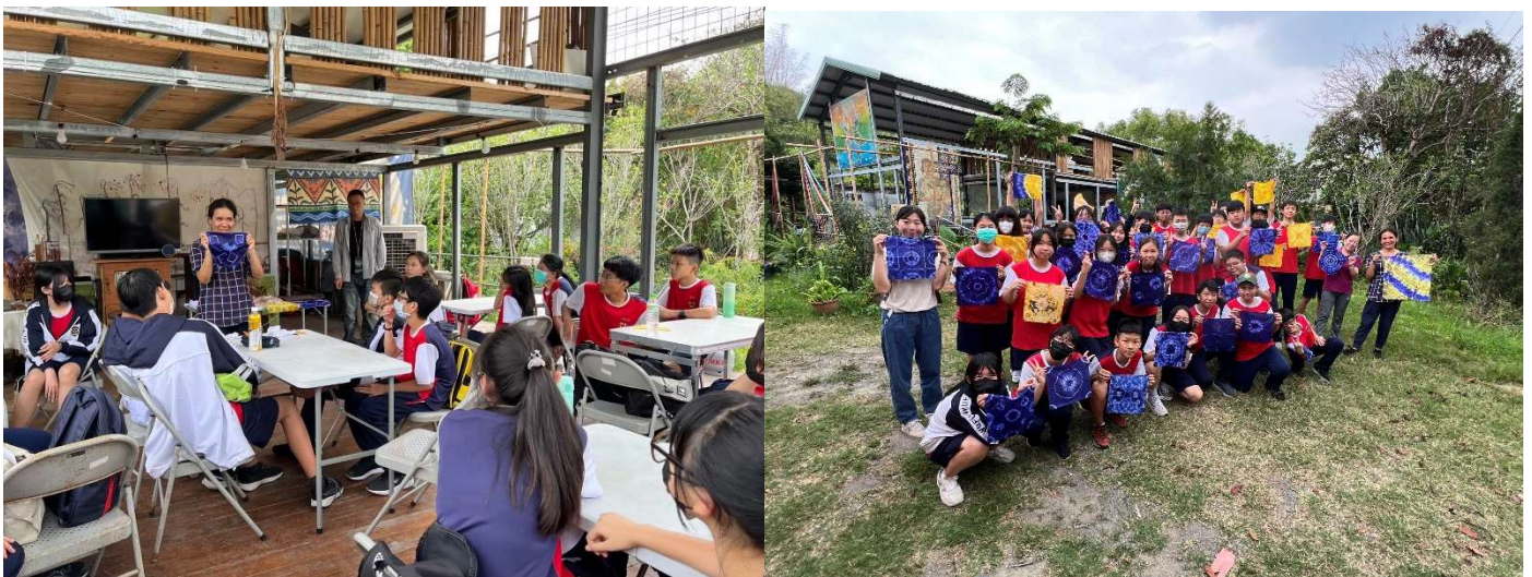
學生在集穡室快樂農場利用當地特色植物進行植物染，每個人的作品都美麗萬分。