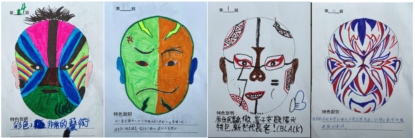
在參觀完宋江兵器展示館後，孩子們分組畫下的組員特色臉譜。