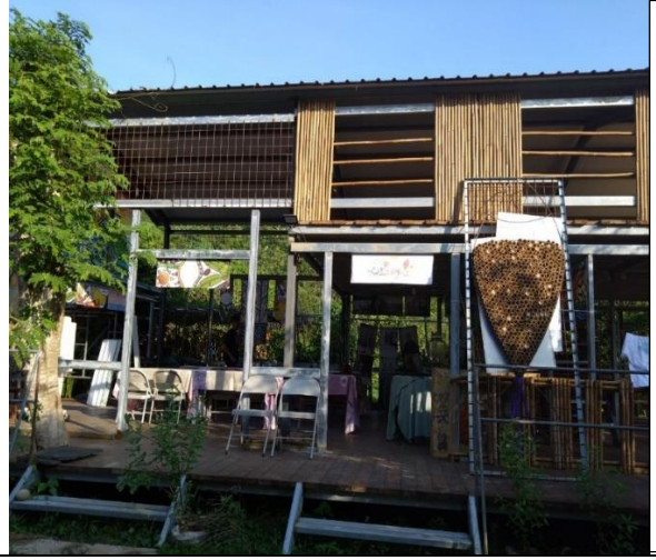
內門區的至高點 高雄市與台南市的分界