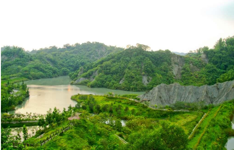
臺陽八景之一的「雁門煙雨」昔日美景

內門的木柵、溝坪地區是平埔族的主要遷居地之一，在族群文化中平埔族有相當重要的地位；清乾隆時期，內門已是一個高開發的地區，可以從古文獻及地圖中，發現一些清朝的地名，如烏山、蝦（蟆）梅林、尪仔上天…等，今日仍延用著。