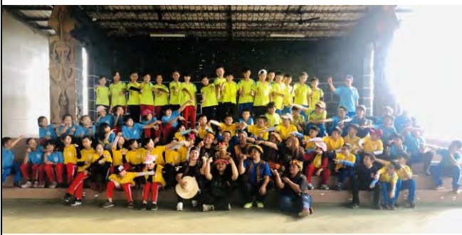
期待下次再相見：大合照