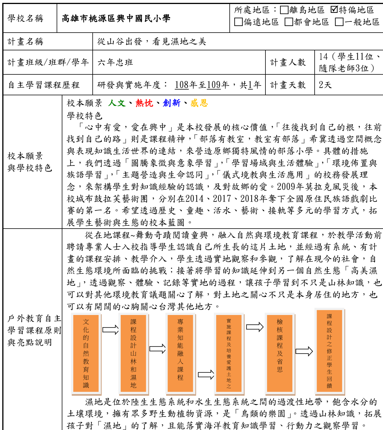
高雄市興中國國民小學108學年度學校辦理「戶外教育自主學習課程」計畫摘要表