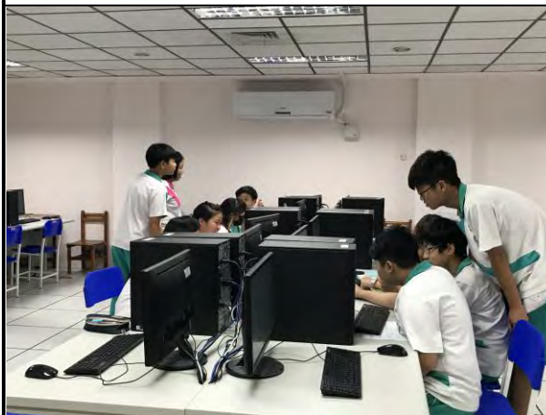
探究成果分析及簡報製作