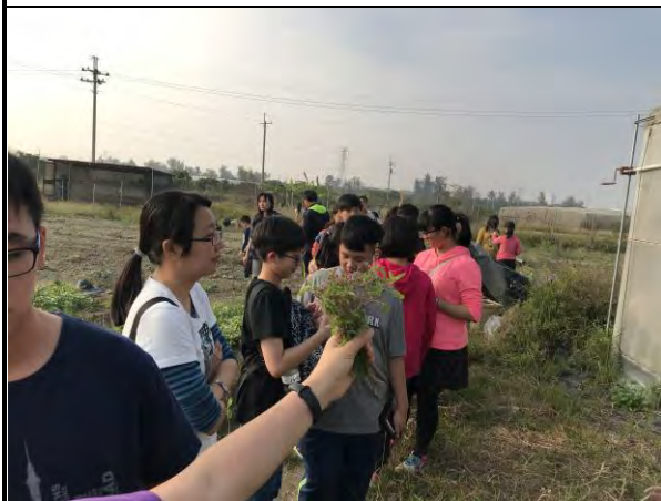
有機農場導覽解說