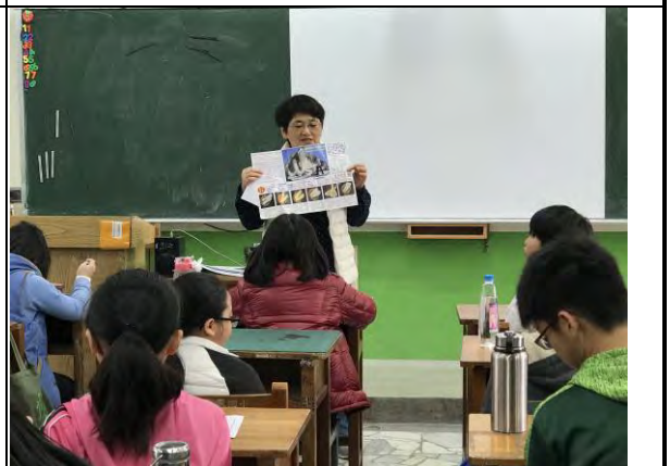
探究在地飲食文化