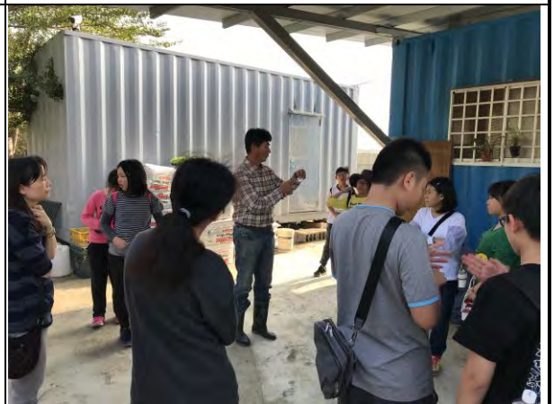
有機農場導覽解說