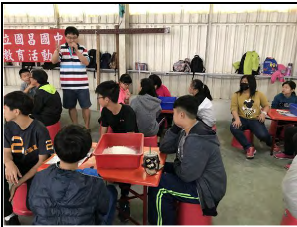
手工麵線製作說明