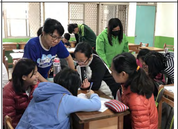
探究成果分析及簡報製作