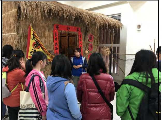
透過解說了解漁民的生活方式與民間信仰