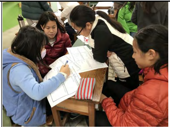
探究在地飲食文化