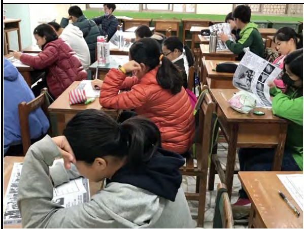
在地飲食地圖繪製