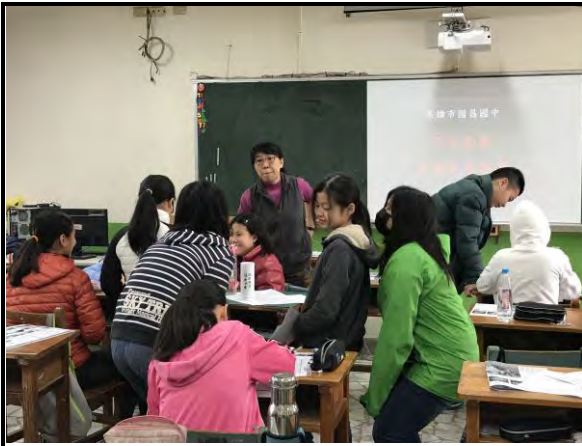
行程規劃及安排設計