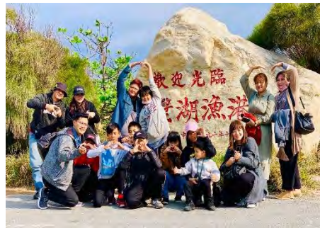
說明：走訪漁港~海洋教育