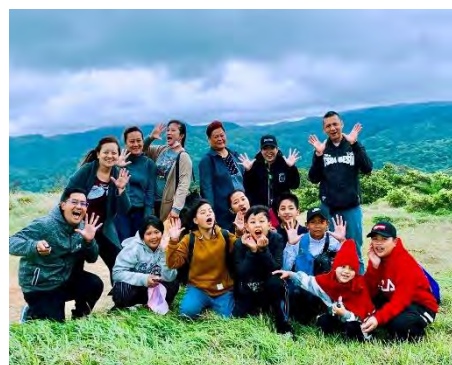
說明：綠色大地~旭海草原。