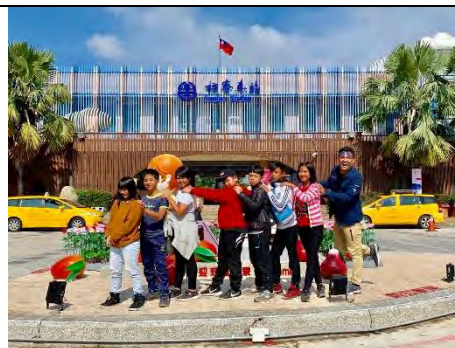
說明：漁港之車站~枋寮車站。