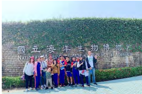
說明：參觀海洋生物博物館。