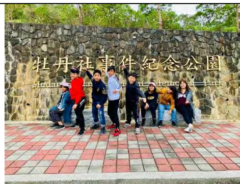
說明：聽古蹟的故事~牡丹事件。