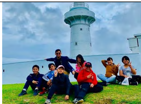
說明：走訪南境之邊的燈塔。