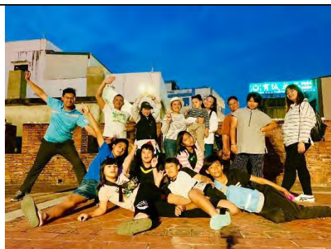
說明：恆春古城巡禮。