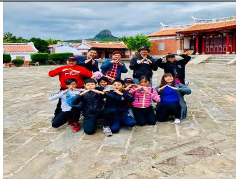
說明：參觀閩南建築之旅。