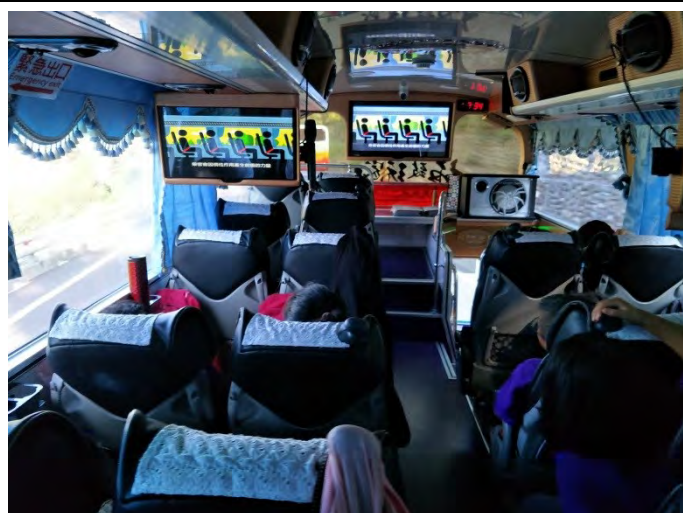
出發前進行遊覽車逃生避難影片介紹