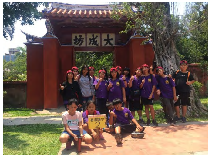
遊覽孔廟文化園區