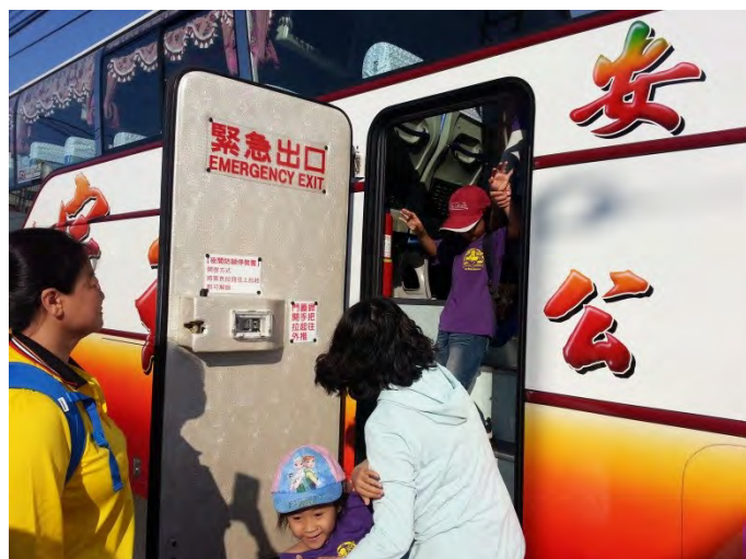
出發前進行遊覽車逃生避難演練