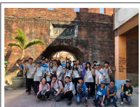
說明：第二站-認識恆春古城