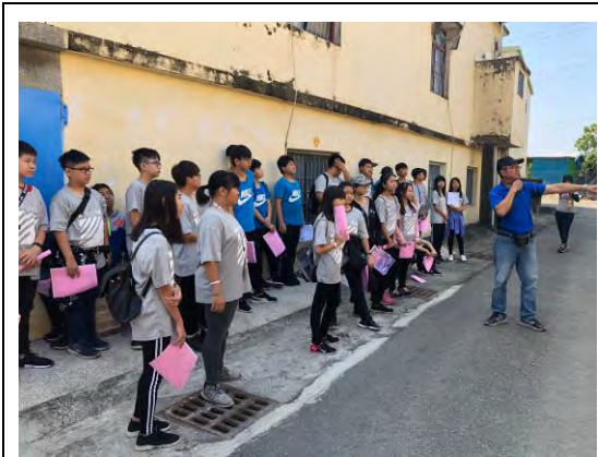
說明：第一站-認識屏東林邊地層下陷的情形