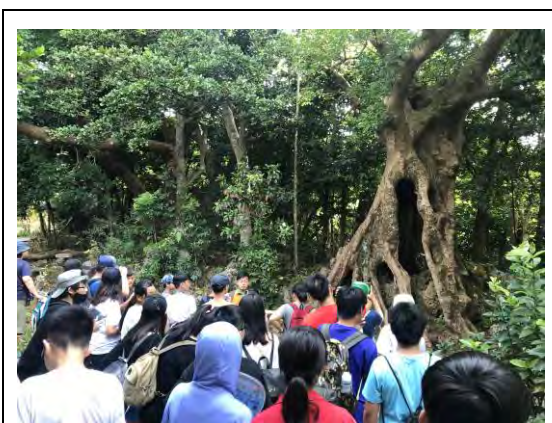
說明：了解園區內獨特的林木