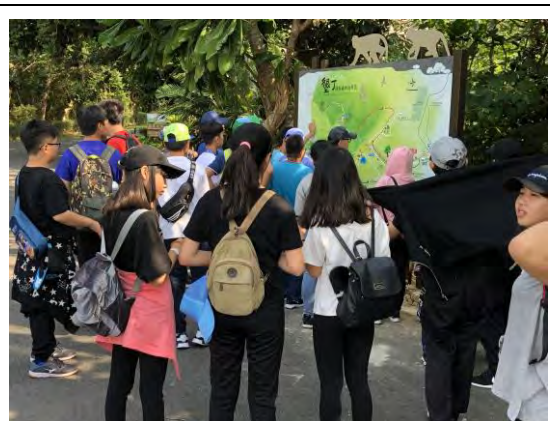
說明：了解園區內的特殊景點