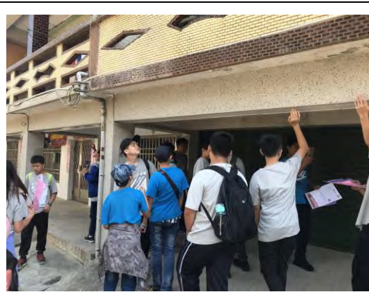
說明：體驗房屋地層下陷的情形