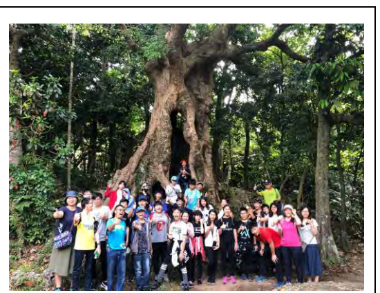
說明：全體戶外教育成員合影