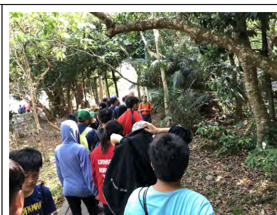
說明：了解園區內植物的特點