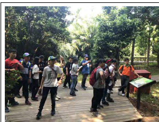
說明：了解園區內植物的多樣性