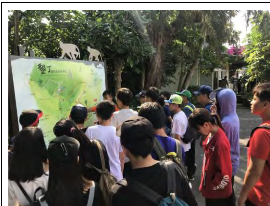
說明：第三站-認識墾丁國家森林遊樂區