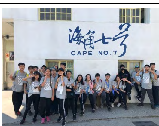
說明：認識恆春文創產業