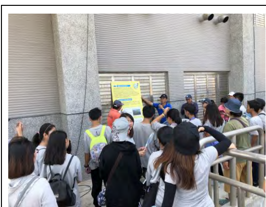
說明：了解目前解決地層下陷解決方法-取水站的建設