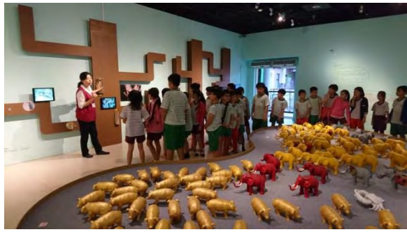
學生專心聽解說員解說