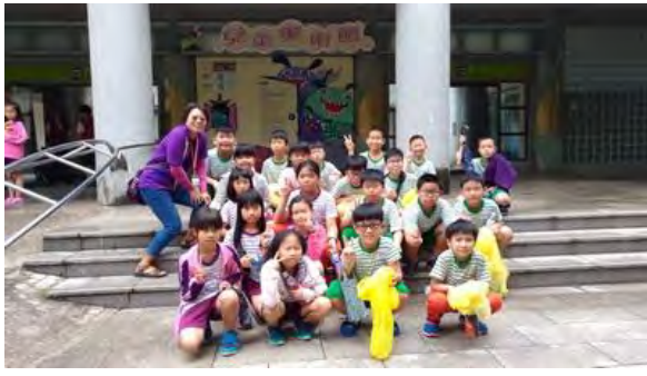
學生參觀兒童美術館