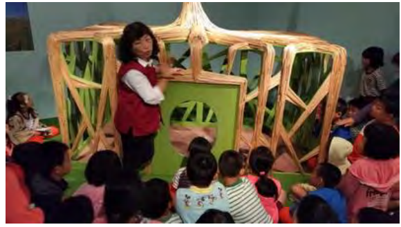
解說員講解原住民樹屋構造