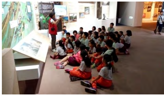
學生專心聽講解災害演變