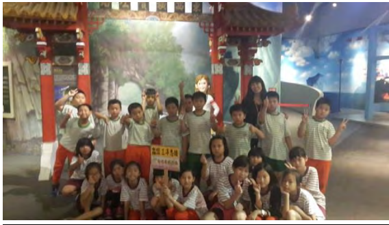
學生在科工館參訪