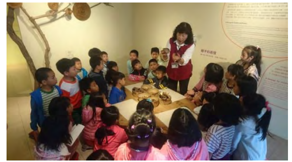
解說員講解植物種子特性