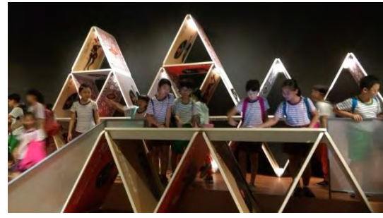
學生在科工館體驗參訪