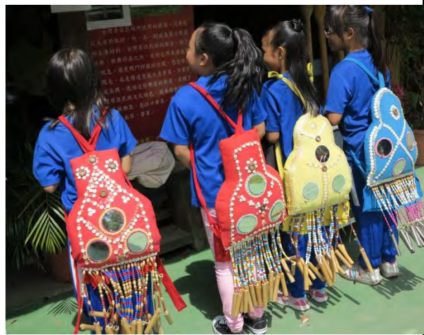
說明：臀鈴是原民樂器文化裡獨特的存在