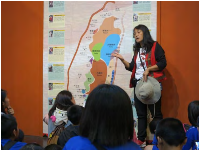
說明：導覽人員引導解說