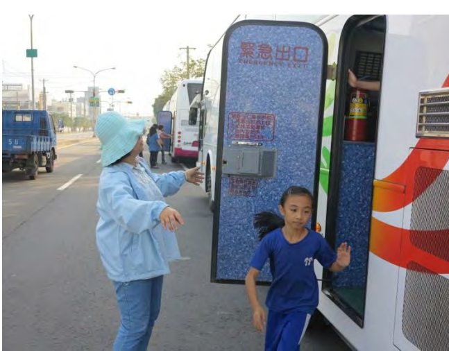
說明：出發前進行車檢與逃生演練