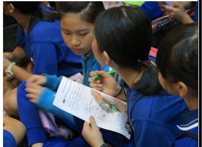
說明：小朋友進行學習單的填寫