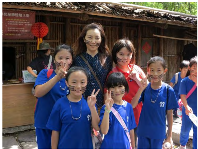
說明：紋面的體驗表示已具有傑出的編織技藝