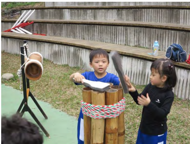
說明：小朋友體驗原住民的樂器敲擊