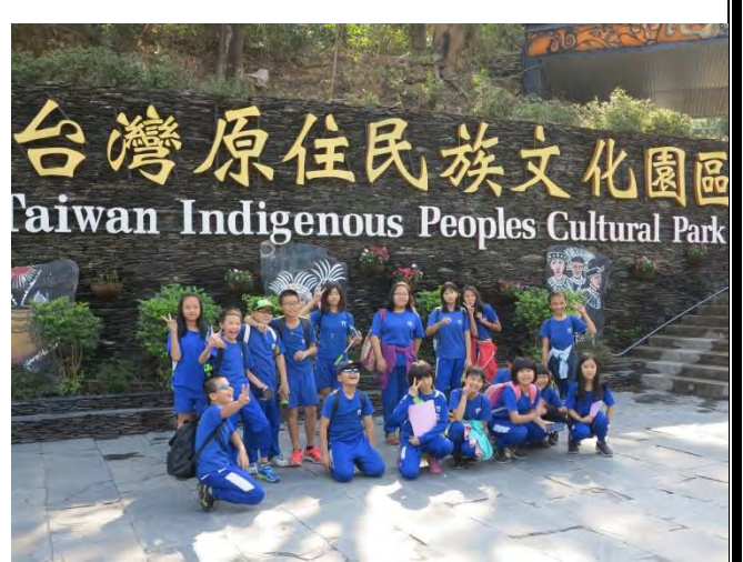
說明：抵達台灣原住民族文化園區合影