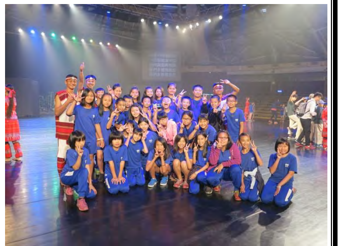
說明：觀賞原民舞蹈並下場同樂