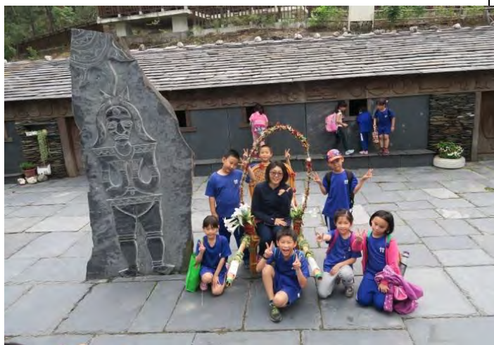
說明：石板屋的建築有著冬暖夏涼的在地特性