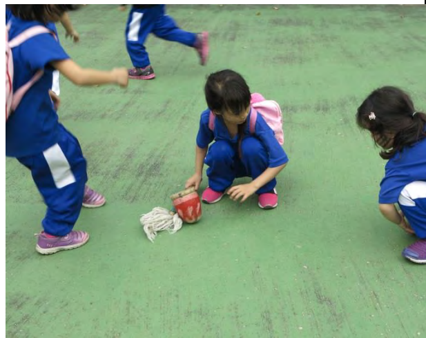
說明：打陀螺不是一件簡單的事