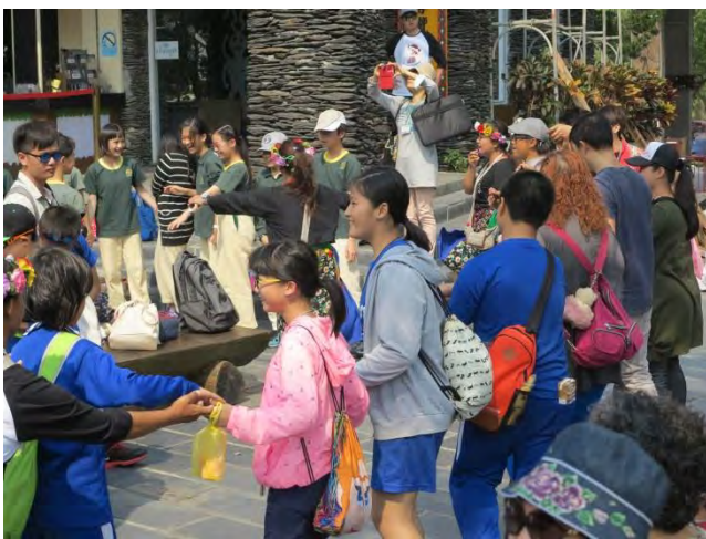
說明：迎賓舞的歡樂顯示原住民族的好客