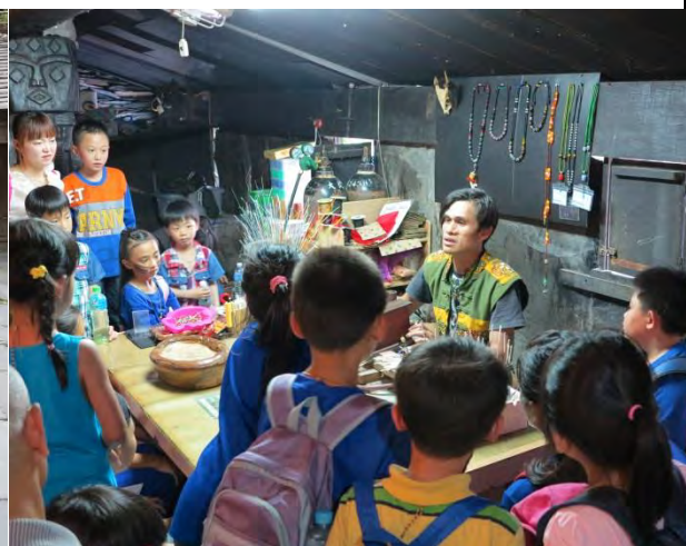
說明：在石板屋內製作琉璃珠的原民少年