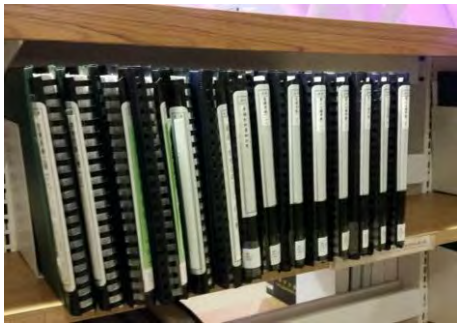
樓的 第 ~ 號櫃