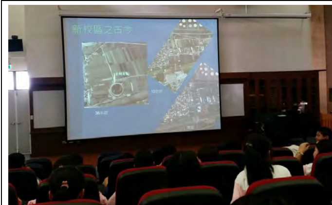
說明：臨海工業區介紹