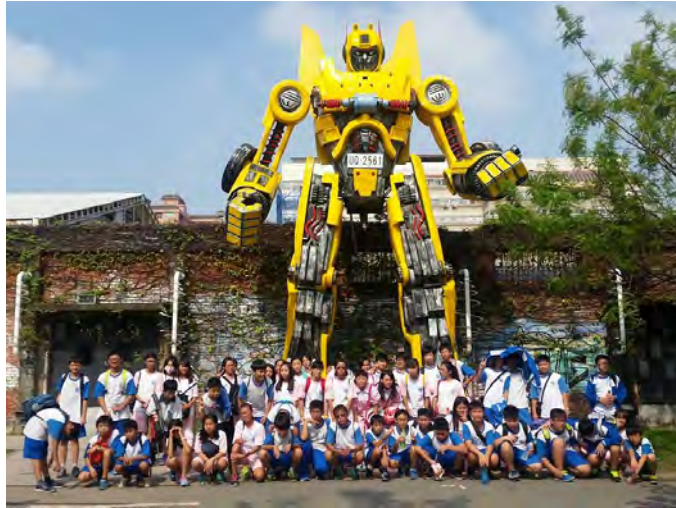
說明：駁二特區與公共藝術品合影