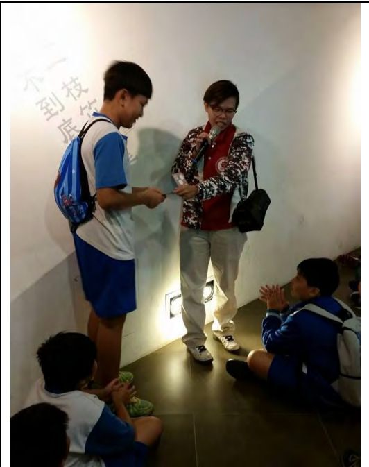
說明：有獎徵答頒獎