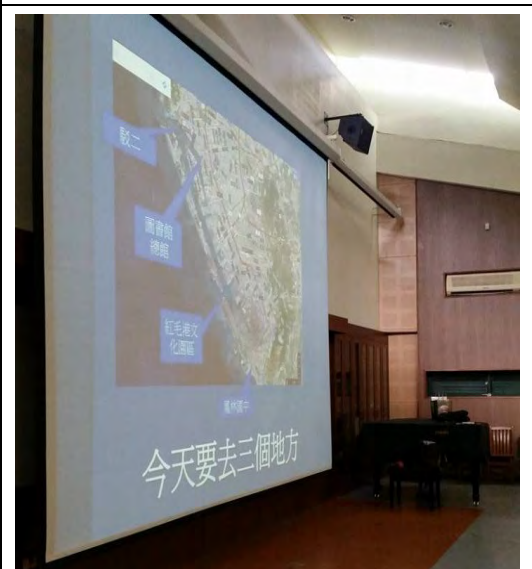
說明：校外教學地點簡介