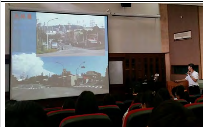
說明：大林埔社區介紹