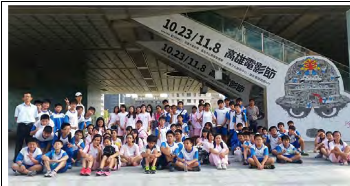
說明：於高雄市立總圖合影