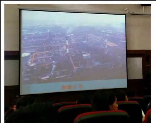
說明：周邊社區的演變