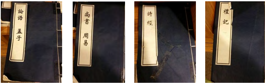
樓的 _____ 區