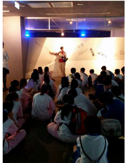
說明：紅毛港文物館館藏講解