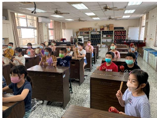
說明：參與活動人員於活動前在音樂課中練習合奏課程。