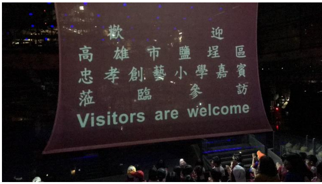
說明：欣賞十鼓擊樂團專業演出。