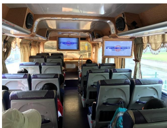
說明：參與活動人員於學校報到、逃生演練後出發，並於遊覽車上實施大客車安全逃生影片收視與講解。