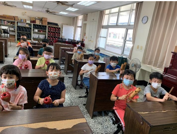
說明：回校後音樂課分組合奏發表。