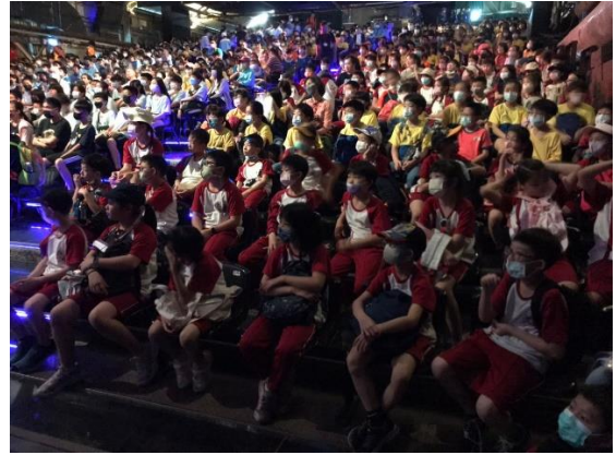
說明：欣賞十鼓擊樂團專業演出。