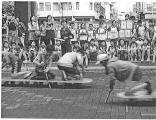
活動說明：陸上龍舟競賽