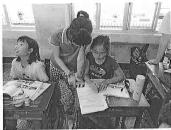
活動說明：海洋歌詞改編