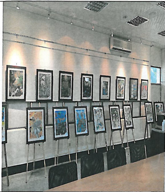
活動說明：藝才班學生作品展