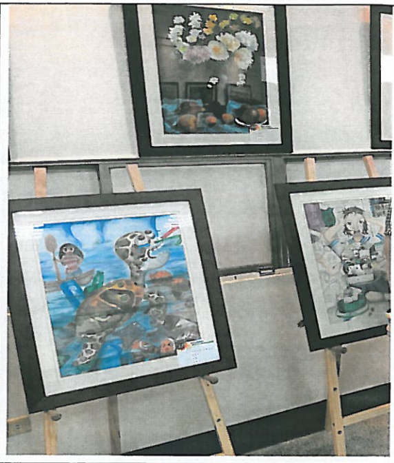
活動說明：學生畫作關心海洋動物