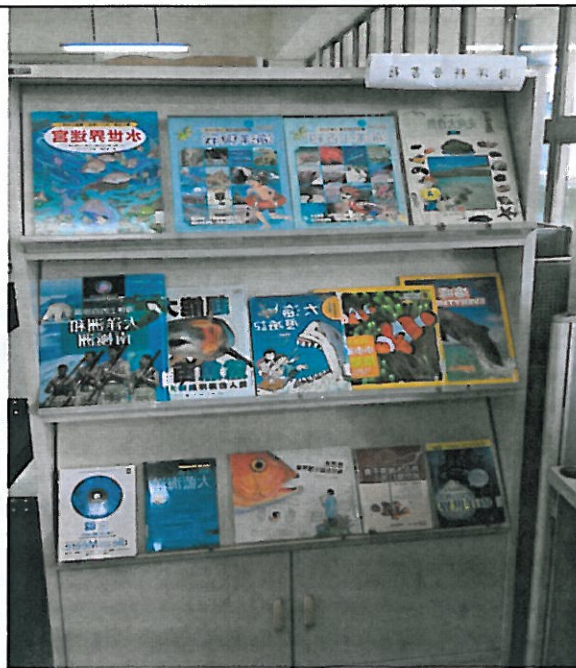
活動說明：海洋教育叢書展示