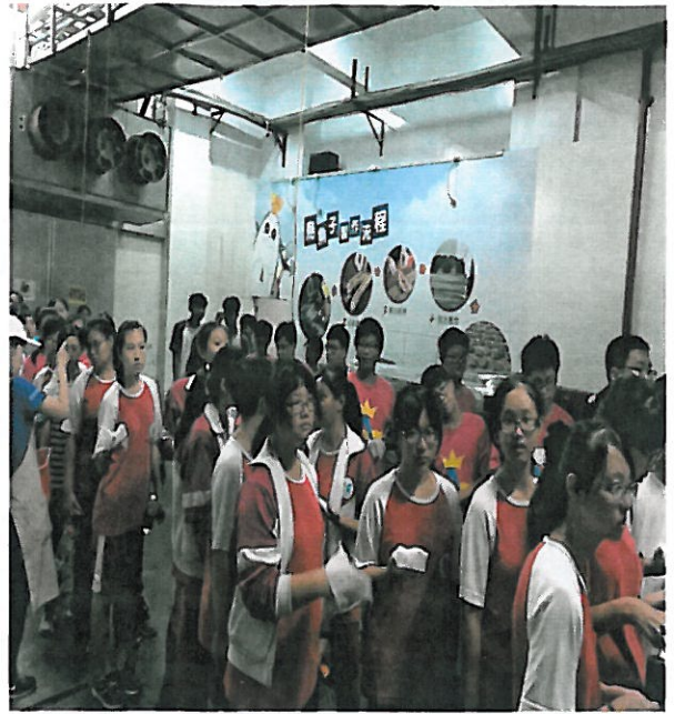
活動說明：了解烏魚子製作過程