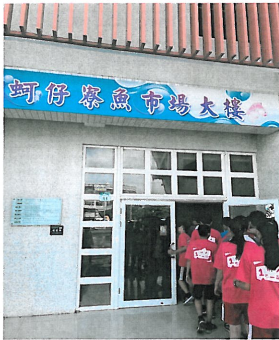
活動說明：校外參訪蚵寮魚市場