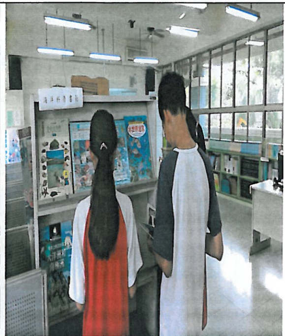
活動說明：學生借閱情形