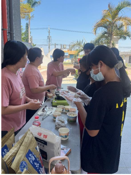
相片說明：校慶時邀請永安當地秀巒魚丸業者設攤讓學生體驗做魚丸的過程並進行食魚教育