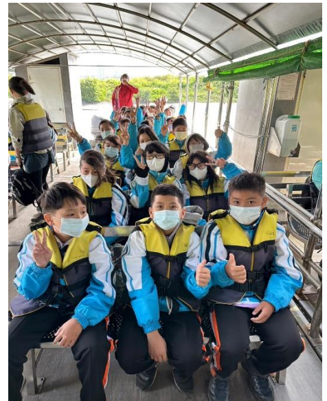
活動說明：由學校老師帶隊一二年級校外教學1121117 台南紅樹林