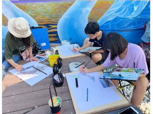
活動說明：由學校老師帶隊參加1121104彌陀漁港虱目魚文化節寫生比賽