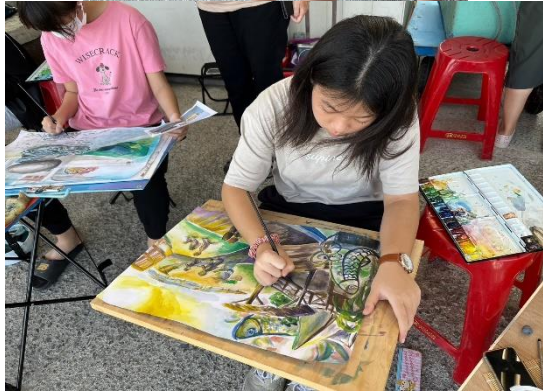
活動說明：學校老師帶隊參加1121104彌陀漁港虱目魚文化節寫生比賽