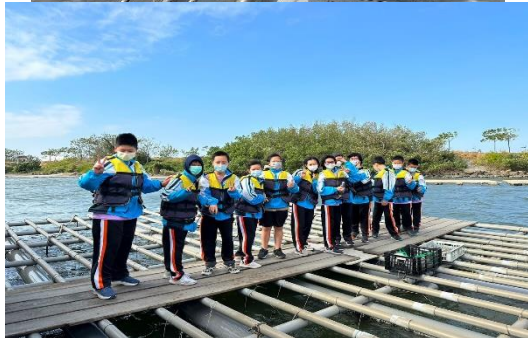
活動說明：由學校老師帶隊一二年級校外教學1121117 台南紅樹林