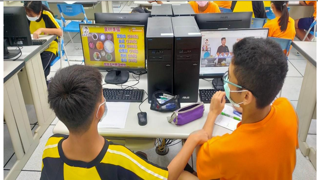
活動說明：於家政課程融入海洋食魚教育-小蝦米立大功，探討蝦米於南瓜炒米粉之效果。