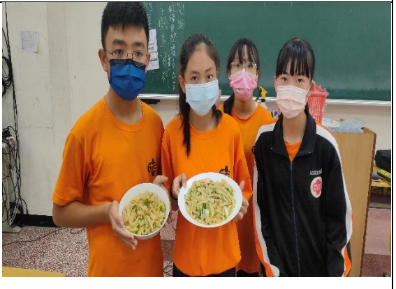
活動說明：於家政課程融入海洋食魚教育-小蝦米立大功，探討蝦米於客家炒板條之效果。