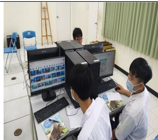
活動說明：於自然課程融入海洋教育，引導學生瀏覽海生館網站。