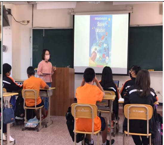
活動說明：使用 Cool English 繪本資源探討海洋與水資源主題。