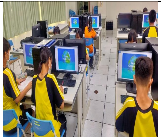
活動說明：於英語領域融入世界海洋日 World Oceans Day 議題