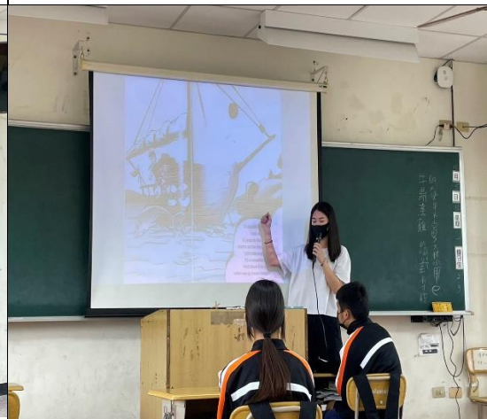
活動說明：海洋教育英語繪本教學。