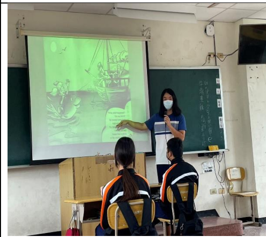
活動說明：海洋教育英語繪本教學。