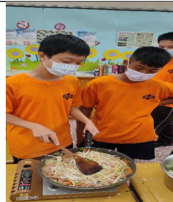
活動說明：於家政課程融入海洋食魚教育-小蝦米立大功，探討蝦米於客家炒板條之效果。