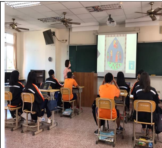
活動說明：使用 Cool English 繪本資源探討海洋與水資源主題。