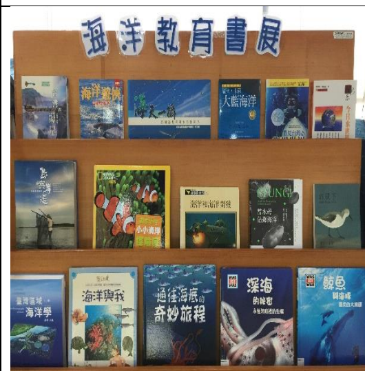
活動說明：辦理圖書館海洋教育主題書展與閱讀活動。