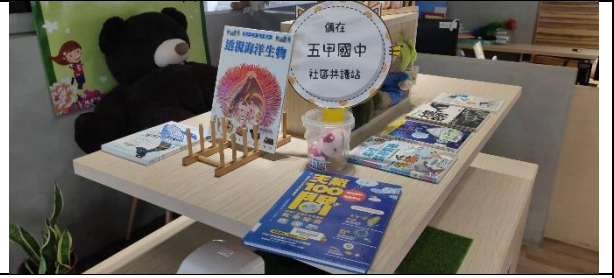
相片說明 圖書館主題書本展