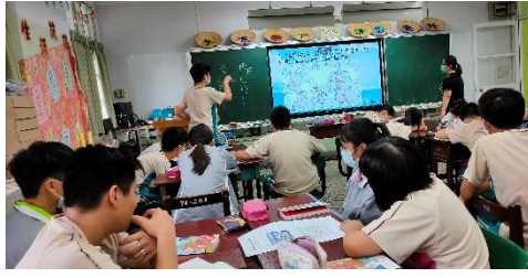
相片說明 同學在課堂上以多媒體方式進行「塑膠濃湯」的課程。