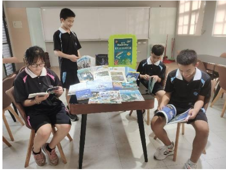
相片說明：邀請學生瀏覽期刊