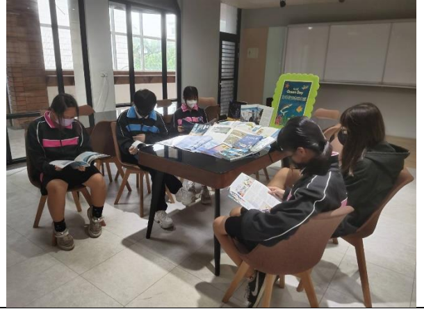
相片說明：邀請學生觀賞海洋書展