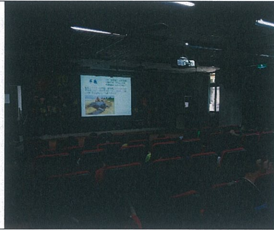
相片說明：東沙的海洋生態介紹。