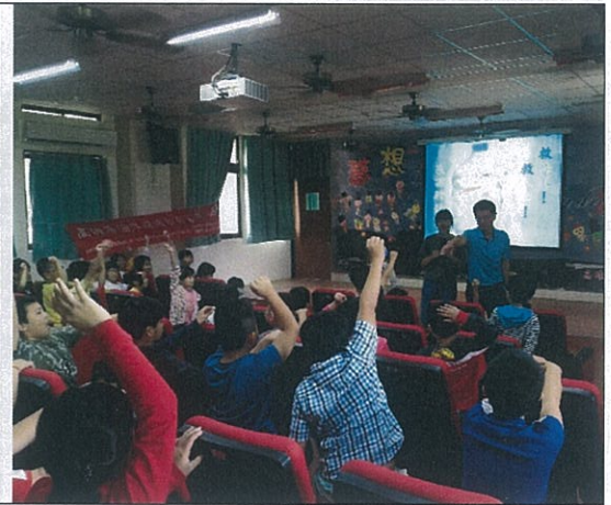
相片說明：校長主持有獎徵答。