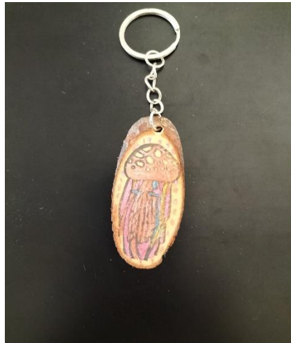
說明: 低年級水母鑰匙圈優選作品