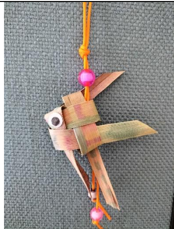
說明:高年級糠榔魚優選作品