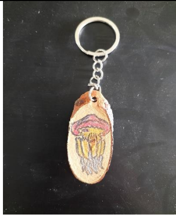
說明:高年級水母鑰匙圈優選作品