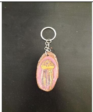
說明: 中年級水母鑰匙圈優選作品