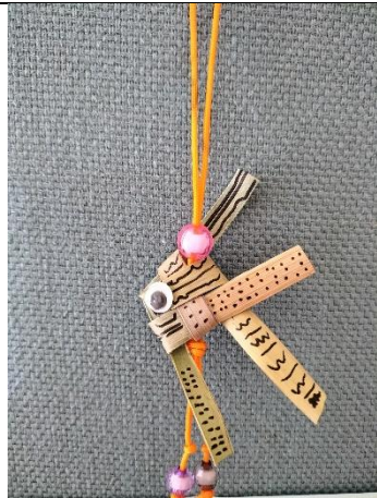
說明:高年級糠榔魚優選作品