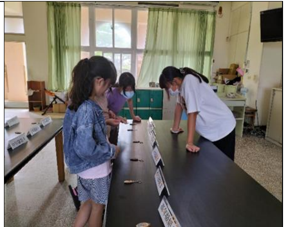
說明: 學生欣賞票選優良水母鑰匙圈作品