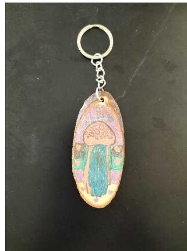
說明: 低年級水母鑰匙圈優選作品