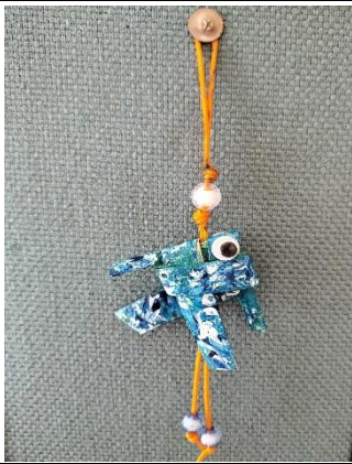
說明:中年級糠榔魚優選作品