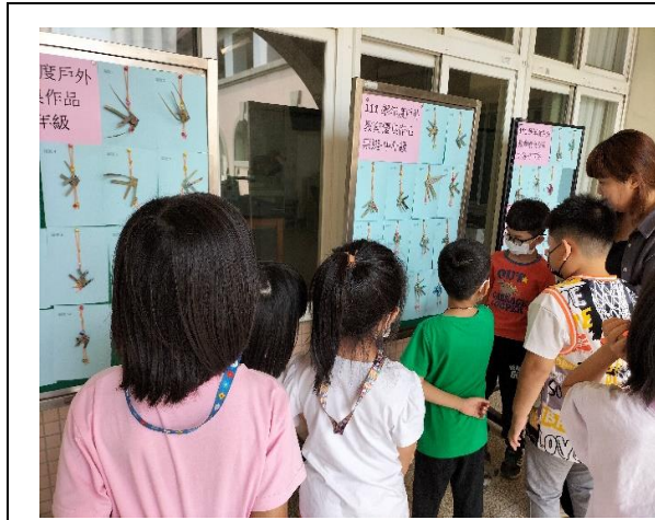
說明: 師生欣賞票選優良糠榔魚作品