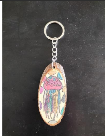
說明:高年級水母鑰匙圈優選作品