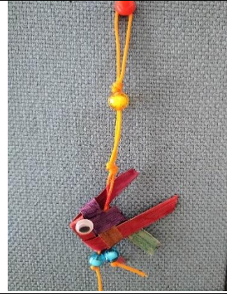
說明:中年級糠榔魚優選作品