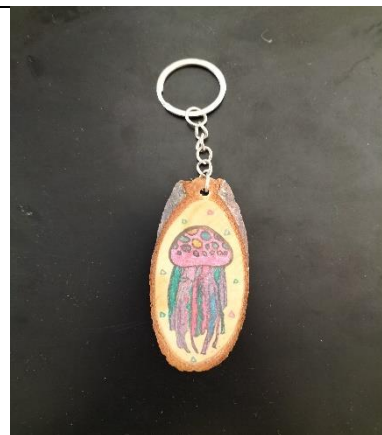
說明: 中年級水母鑰匙圈優選作品