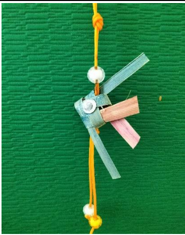
說明:低年級糠榔魚優選作品