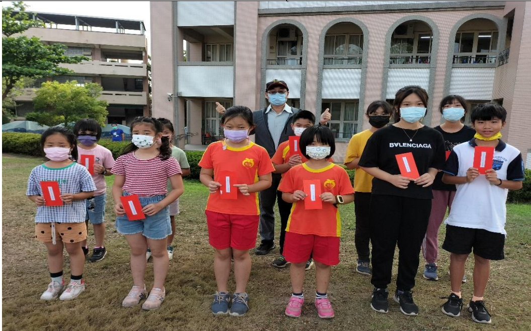
說明:戶外教育優選作品頒獎